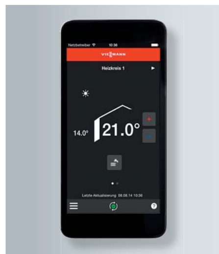
Vitotrol Plus App

Bereits ab Werk verfügt Vitodens 333-F über eine integrierte Internetschnittstelle. Per Vitotrol Plus App lässt es sich vom Smartphone oder Tablet von überall regeln. Heizgerät und DSL-Router können über ein Ethernet-Kabel direkt miteinander verbunden werden.