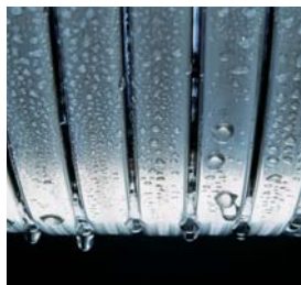
Inox-Radial-Wärmetauscher – langlebig und effizient